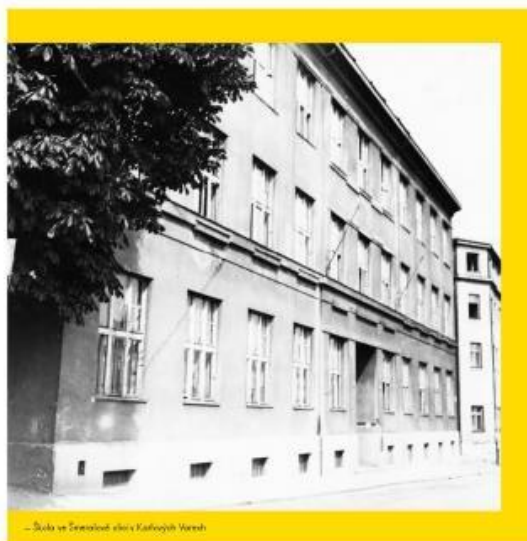
— Škola ve Šmeralově ulici v Karlových Varech

Vzhledem ke smutným politickým událostem byla výuka na této škole ukončena 15. září 1938, a to na dlouhých sedm let.