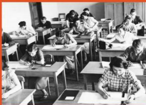
— Z čerstvého učebnice knihy