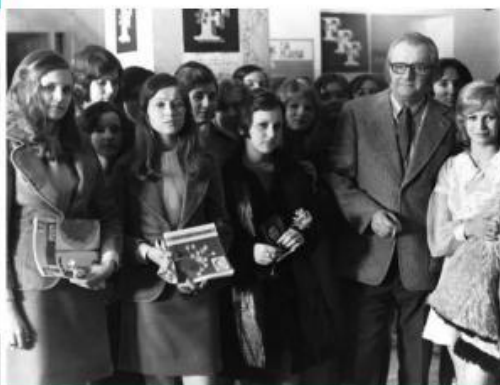
— 22. srpna 1974 přišel přednášet ruský filmový režisér a scenárista Jurij Z. Ozerov (přítel studentů).