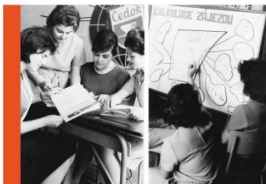
— Z učebnice učebnice