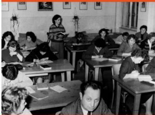
— Hodiny češtiny