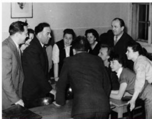
— Studenti při práci

Významným počinem bylo v roce 1957 založení oboru Ekonomika cestovního ruchu a lázeňství. Vyučování bylo zahájeno 1. září 1958. Škola tohoto druhu byla první v celém socialistickém bloku a do roku 1967 jediná v Československu. Existovala jako dvouleté nástavbové studium pro absolventy středních škol.