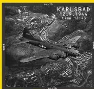
— Bombardování Karlových Varů