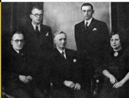
— Profesorský sbor

Naše škola v Rybářích byla tohoto řádění ušetřena. Po této strašlivé noci dne 15. září 1938 vyhlášením stanného práva ve městě byl obnoven klid, ordneři uprchli do Německa. Žactvo už do školy nepřišlo a rozjelo se do svých domovů. 30. září 1938 odjížděli posledním vlakem členové profesorského sboru.