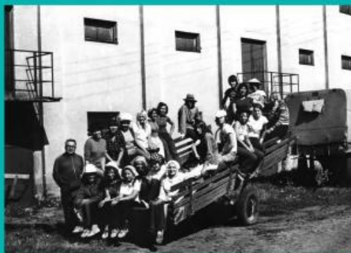
— Časová škola —