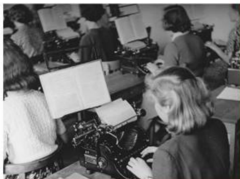
— Písařské školy byly důležitá učebnice