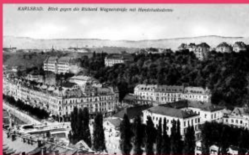
— Během války Bezručova 17