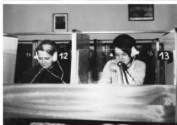
— Jazyková škola