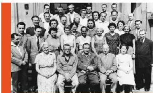
— Pohled do výuky v období mezi 1930-1940

Pohled do výuky v průběhu let. Součástí výuky byly hodiny branné výchovy. V rámci tohoto předmětu každoročně probíhala branná cvičení, kdy žáci zkoušeli svou fyzickou zdatnost při běhu v plynových maskách či střelbě na cíl ze vzduchovek.