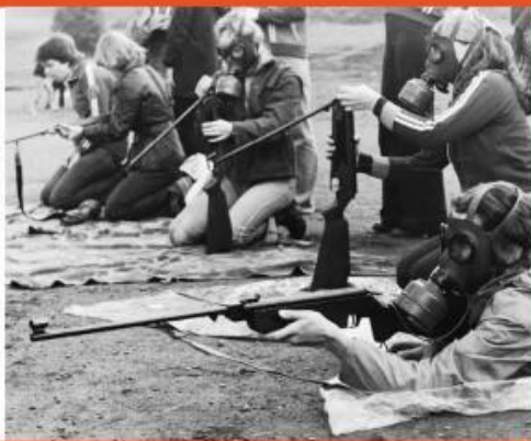
— Účast na branné výchově