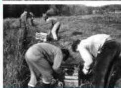
— Práce při výstavě zemědělníků —